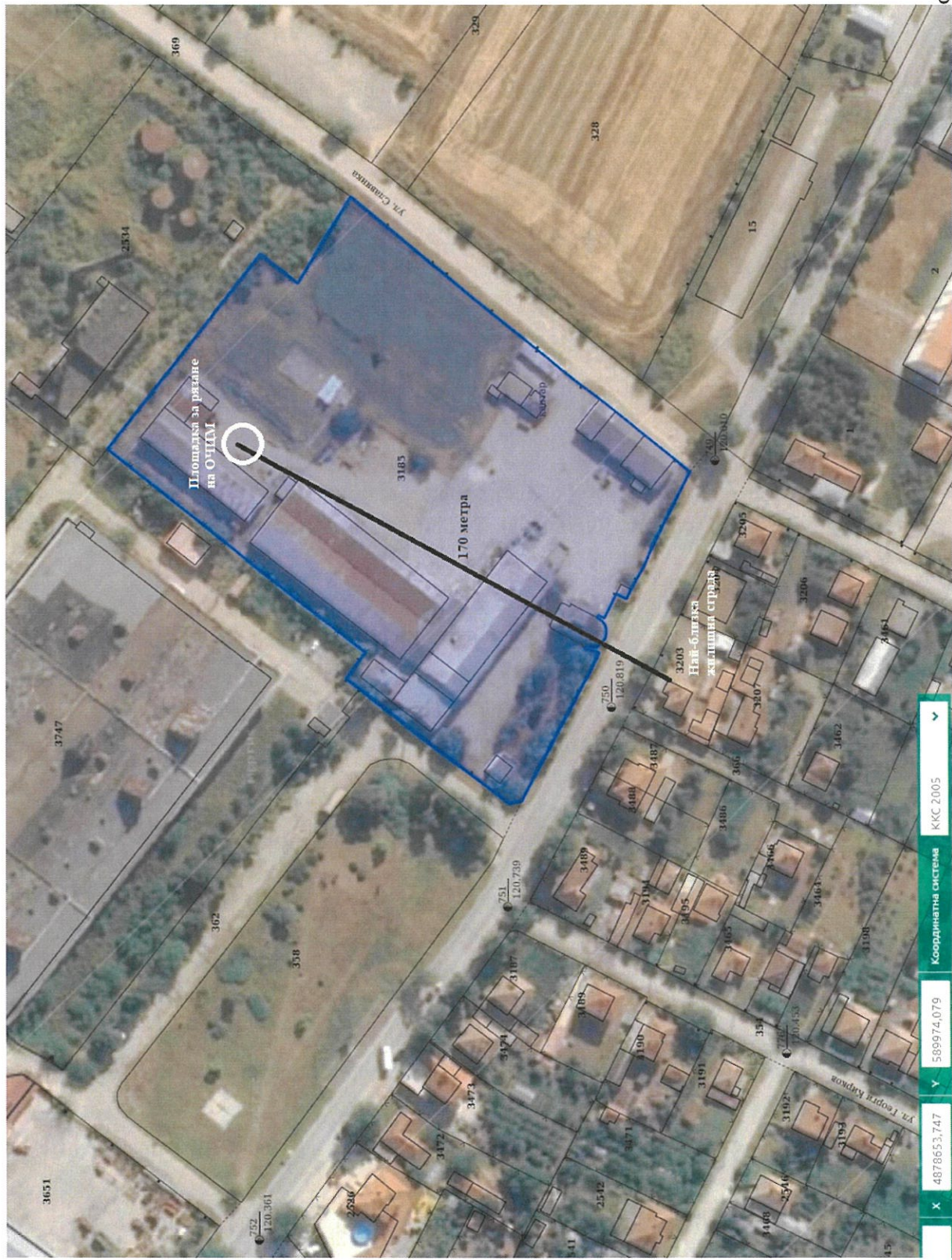
Фиг. 1.1 31

Обособяване на площадка за претриране на отпадъци – ОЦДМ, ИУЕЕО, ИУМПС, НУБА и други, с местоположение измот с идентификатор 73496.501.3185 по плана на зр. Тутракан – възложител „НАДИН 22“ ЕООД